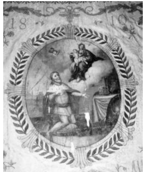
2. A fejér megyei felkelők zászlója